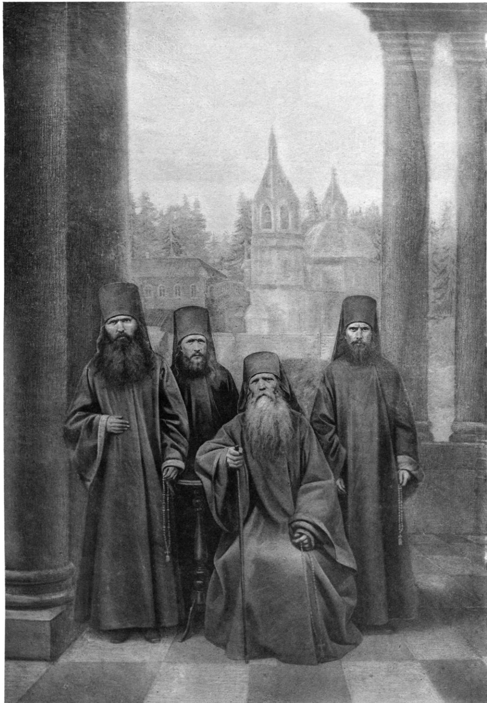
ФОТО-ГРАВИЮРА М. САМОЙЛОВА.